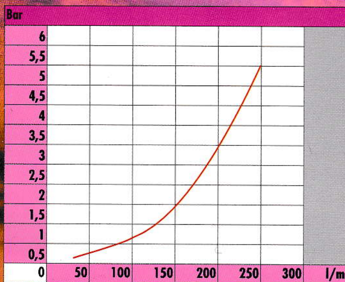
DIAGRAMMA PERDITE DI CARICO LOSS PRESSURE DIAGRAM