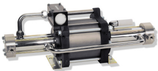
DLE 15-75 einfachwirkend, einfacher Luftantrieb, zweistufig